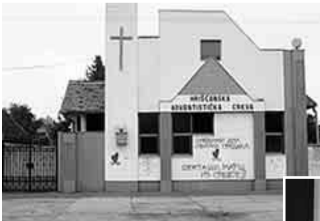
През последния септември заплахи бяха изписани с графити върху стените на адвентната църква в Сивак. Според ръководителите на църквата властите не са направили нещо, за да възпрат вандалите.

Адвентистите се страхуват за сигурността си, тъй като са вандализирани и заплашвани