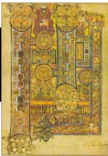
Страници от книгата на Келс, която играе изключително значима роля в християнската средновековна култура на Британския остров. Новооткритата книга е от същия исторически период

"Когато за пръв път го видяхме в мочурището, можяхме да прочетем един от псалмите на латински" - до