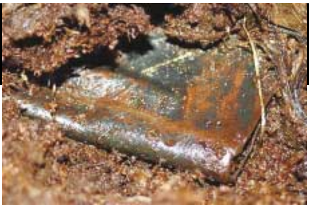
1200 години се оказват недостатъчни, за да унищожат боговдъхновената поезия на Давид, Соломон, Асаф и другите библейски автори на Псалтира.

Д-р Уолъс заяви, че въпреки че манускриптът не е в първоначалното си непокътнато състояние, голяма част от написаното може да се чете дори без реставрация.