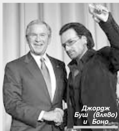
Джордж Буш (вляво) и Боно

В реч пред президента на САЩ - Джордж Буш - и членове на Конгреса по време на националната молитвена закуска Боно, който е фронтмен на групата U2, както и посланик на добра воля към ООН, заяви, че е неправда да се пречи на бедните народи да продават стоките си, докато в същото време богатите страни възхваляват добродетелите на свободния икономически пазар, че е нередно да бъдат принуждавани децата да плащат дълговете на своите деди, докато им се отказва лечение, което би спасило живота им.