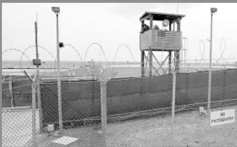
Военноморската база на САЩ "Гуантанамо Бей" в Куба е едно от местата, за които защитниците на човешките права твърдят, че системно и сурово е била нарушавана Хартата за правата на човека.

Дори и да не вземаме предвид в разсъжденията си чудовищните последици, които изникват, щом дадено правителство спонсорира изтезания, все пак има един елемент в този спор, който не може да бъде пренебрегнат от приемащите Библията вярващи. Християнинът не може да гледа на терористите като на нечовеци, недостойни за универсалните права, които предпазват от изтезания цялото човечество, включващо както добрите граждани на една държава, така и злите чужденци и неверници. Като Божии творения всички хора имат гарантирани им права, залегнали и в множество конституции на държавите по света. Ако отхвърлим Създателя, не би имало причина тези права да бъдат прилагани. Ето защо за мнозина изтезанията е оправдаемо, щом крайната цел е някое висше благо. В пълен контраст с това християнският възглед е принципен и противоречи на първичната човешка логика. Сам Бог, Създателят на човечеството, умря, за да спаси тези жалки същества, които смятат, че Го почитат, като погубват себе си заедно с други невинни хора. Дивото скандиране, че изтезанията ще спаси собствените ни кожи, едва ли е в хармония с Божествените принципи и напълно игнорира Неговата заповед "Обичайте неприятелиите си, правете добро на тия, които ви мразят" (Лука 6:27).