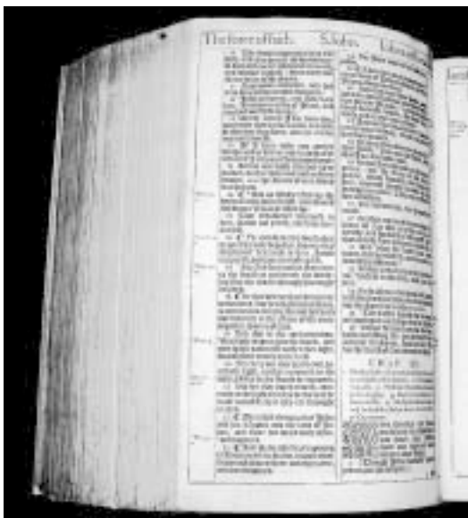
Първо издание от 1611 г. на английския превод на Библията, познат като "King James". За да го осъществят, 47 учени работят в продължение на 5 години по време на управлението на крал Джеймс I (от 1603 до 1625 г.). След публикуването му преводът оказва огромно влияние върху цялостното развитие на английската литература. Творби на известни автори като Джон Бънян, Джон Милтън, Хърман Мелвил и Уилям Уърдсуърд черпят вдъхновението си от него. Съвременни широко разпространени преводи на Библията като New American Standard Bible и English Standard Version са всъщност силно ревизираны издания на King James. Дори може би най-разпространеният нов цялостен превод на Свещеното Писание - New International Version, е все пак силно повлиян от първия. В изложбата има два екземпляра от първото издание.

Фрагмент от Евангелието на Йоан. Фрагментът (гл.8 от стих 14 до 22) от 3 век е познат като "Папирус Оксиринкус", а в научните среди като P39. Това е една от най-ранните известни гнес части от ръкопис на Новия Завет.