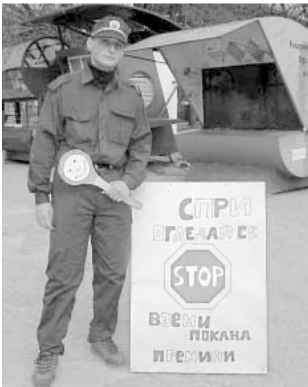
Заради преоблечения "полицай" Алек, който спираше хората, имаше проблеми с русенските полицаи, но се уредиха по начин, който удовлетворяваше и двете страни.

жителите на град Русе имаха възможност да обогатят християнските си разбирания по един недоматичен начин. Петте вечерни теми бяха атрактивно рекламирани през съответните следобеди чрез музикален щанд; "просяк", който черпи с бонбони; преоблечен полицай; телескоп, през който вместо звезди, се вижда реклама; стена на аргументите и анкета за религиозни мнения. Новото тази година беше детският щанд в парка - фигурките за оцветяване и балоните