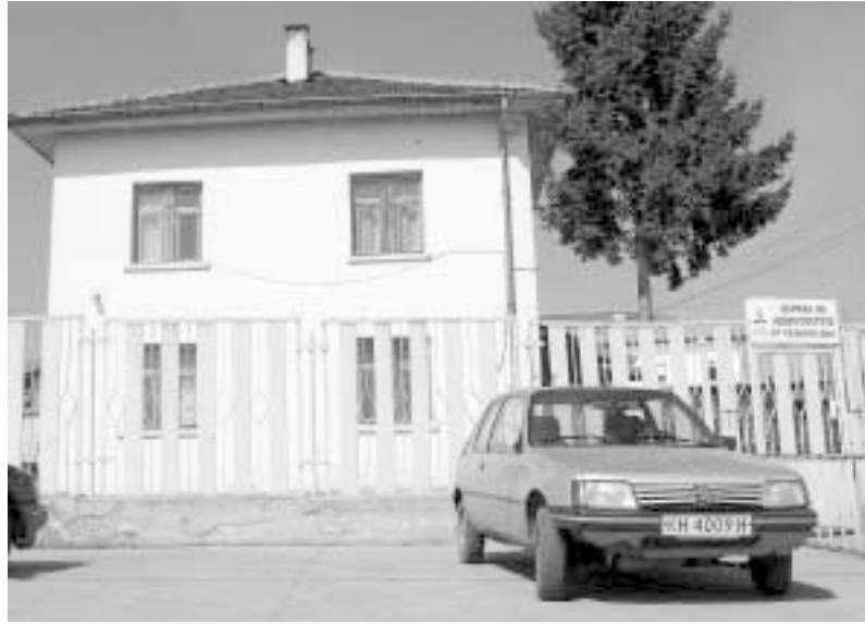
Една от ромските църкви в Кюстендил.