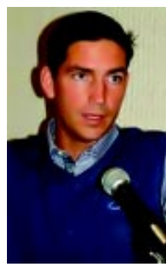
Актьорът Джим Кавизел в ролята на Христос по време на пржекциите след специалната прожекция за 61-та Национална религиозна конференция в Северна Каролина.

Въпреки всичко това обаче, трябва ли адвентистите да се втурнат към ки-