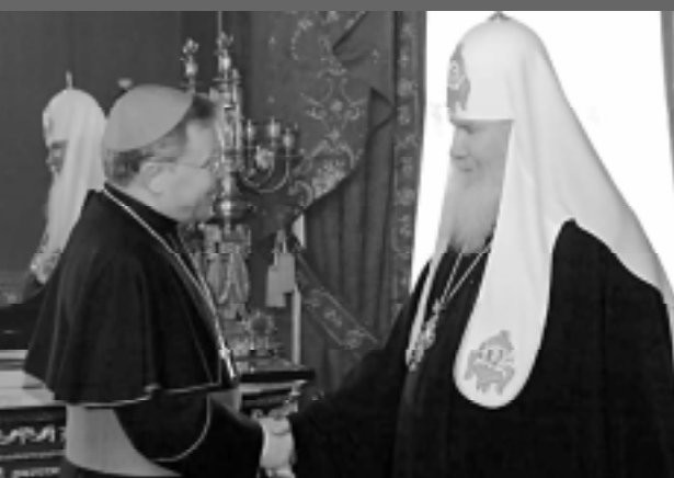
Кардинал Уолтър Каспър (вляво), глава на Ватиканския папски съвет, и руският патриарх Алексей II по време на срещата си в патриаршеската резиденция в Москва на 22 февруари.

Интернет-адресът на българската адвентна църква е www.sdabg.org . За съжаление, България все още е много далеч от подобни инициативи. ХМ