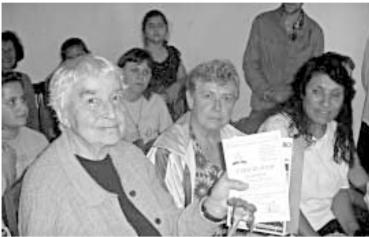
На 24 юни 2006 г. представители от Враца, Бяла Слатина, с. Баница, Роман, Мездра, Криводол, с. Галатин, с. Пудрия се присъединиха към адвентната църква.

Едно е ясно. Най-скъпоценната придобивка за всички бе Исусовото благоволение. Чувствахме се истински богати. Благодарим на Бога за подарената ни радост.