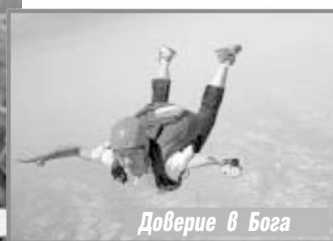
Доверие в Бога