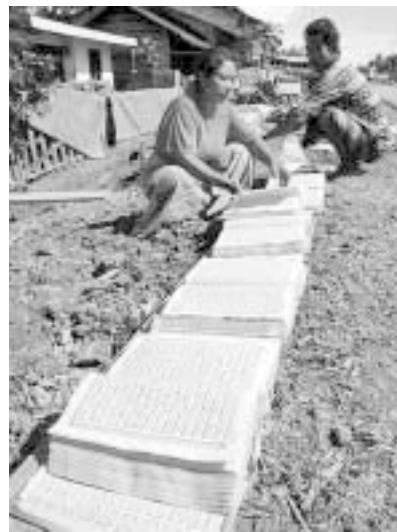
Жена суши корана в Ачех Барат. Възстановяването на културата и образованието са изключително важни за връщането към нормалния живот в Индонезия.

Според мандата, получен от UNICEF, и специалния меморандум, сключен с правителството, АДРА ще съсредоточи върху образователния сектор и, поемайки водещата роля в региона, ще координира възстановяването на учебните сгради. ANN