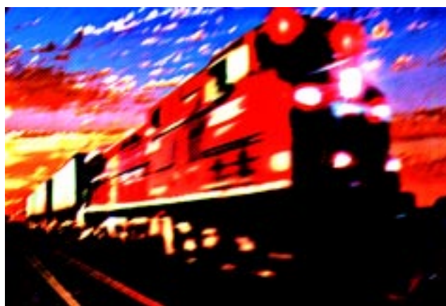
Много пъти почивката означава прехвърляне от един препускащ „експрес“ на друг.

Почивката два пъти годишно не е лукс, а необходимост, твърдят лекари и психолози. Но и тази, която се случва веднъж на седем дни - също. Така е постановил Създателят посредством седмичния цикъл, който ни е дал.