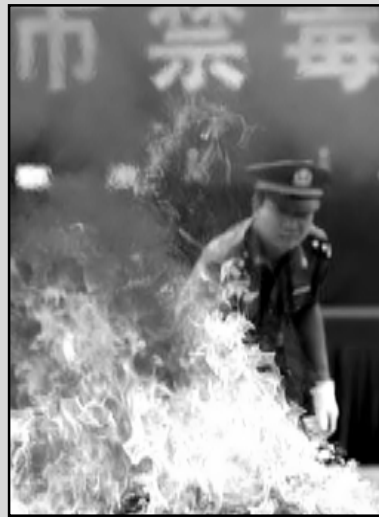
Мнозина християни са били арестувани, а няколко църкви - затворени в Лаос (снимката вляво). Китай (снимката вдясно) за първи път попадна в челната десетка на организацията „Отворени врати“, ежегодно публикуваща списък на страните, в които християните са преследвани заради религиозните си убеждения.

който да разберем понасяните от нас трагедии. В никакъв случай не искам да оспоря човешката способност да се учим от страданията си. Но остава фактът, че в прекалено много случаи цената на покупката е била твърде висока. Формулирането на някакъв извод не е удовлетворителен отговор за нашата болка.