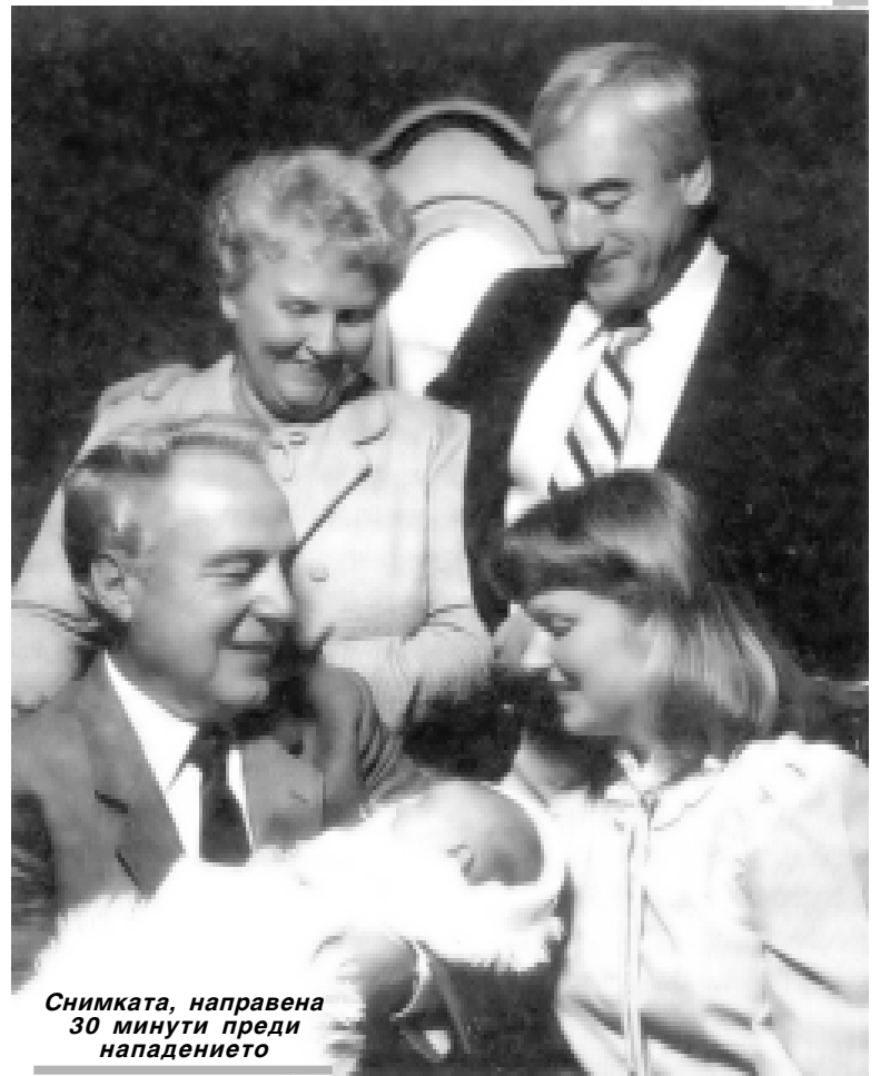
Снимката, направена 30 минути преди нападението

Татко беше изписан от болницата след два дни. За щастие при него имаше само не дълбоки рани по лицето и гърба. Ножът не беше засегнал жизненоважни артерии, беше минал на два-три сантиметра от тях. Физически оздравя след две седмици, емоционално му трябваше много повече време. Животът ти да бъде подложен на опасност от страна на собственото ти дете - това още дълго оставаше за него едно от най-непреодолимите неща.