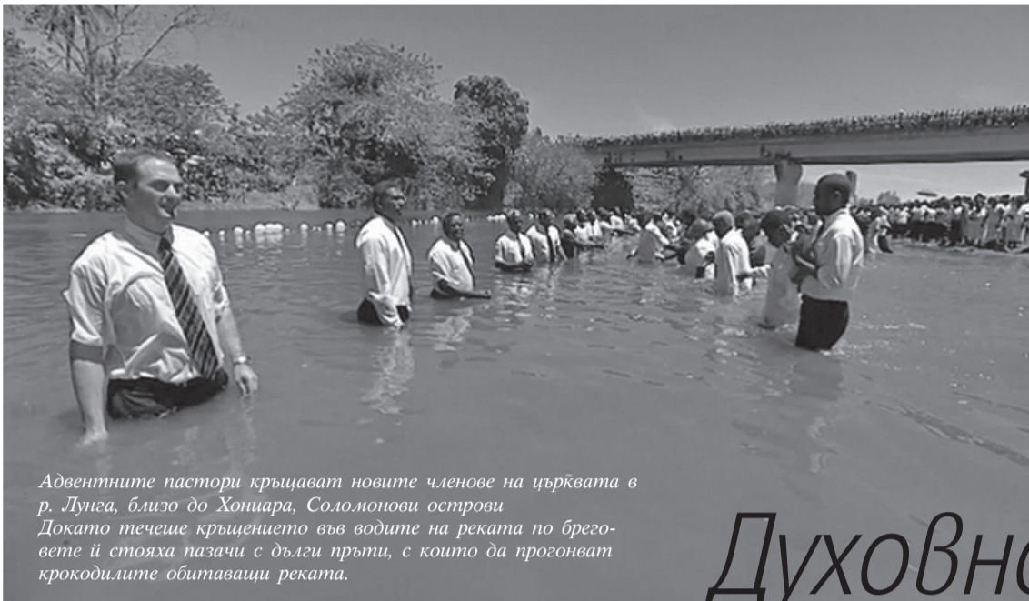
Адвентните пастори кръщават новите членове на църквата в р. Лунга, близо до Хониара, Соломонови острови. Докато течеше кръщението във водите на реката по бреговете ѝ стояха пазачи с дълги пръти, с които да прогонват крокодилите обитаващи реката.

Повече от 500 човека на Соломоновите острови се присъединиха към Църквата на адвентистите след серия от публични проповеди