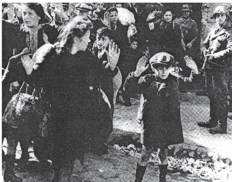
Националсоциализмът в Германия прави опит да изтребят една цяла нация. Холокостът довежда до унищожаването на 60% от евреите в Европа около една трета от еврейското население на Земята. Християните в Европа мълчат.

проповядваме Словото „навреме и без време“? Желаме ли да застанем на страната на гонените, дори това да