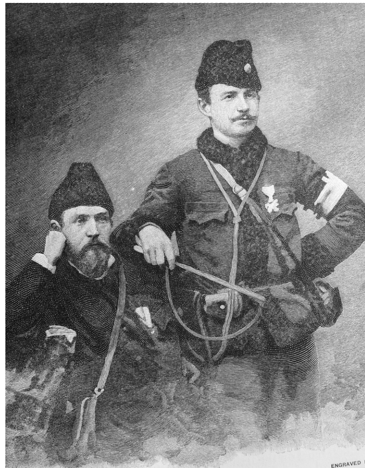
Джанюариъс Алоийъс Макгахан (1844-1878) и Франсис Милет (1846-1912) са кореспонденти за Daily News по време на Руско-турската освободителна война (1877 - 1878)

От подписването на Санстефанския предварителен договор между Русия и Турция на 3 март 1878 г., който слага началото на съвременна България, до юли 1879 г. българските земи е трябвало да бъдат управлявани от временно руско правителство. Междувременно окончателният Берлински договор от 13 юли 1878 г. доуточнява, че България се разделя на три области с различен статут: Княжество България (васално на Тур-