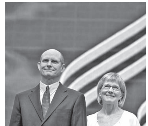
Тед Уилсън със съпругата си Нанси на подиума след избирането му за президент на Адвентната църква.

По време на своята реч към делегатите той бе пригружаван от своята съпруга Нанси Луиз Волмър