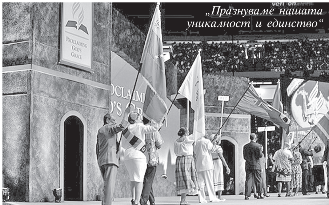
„Празнуваме нашата уникалност и единство“