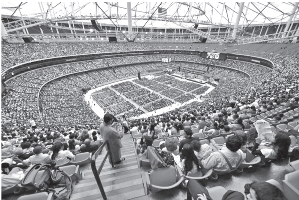
Залата (отвън на малката снимка) в Атланта побираше над 60 хил. души и бе препълнена по време на съботното богослужение.

Това е точната дума! И е сякаш недостатъчна, за да предаде усещането от всичко преживяно! Впечатляващо начало с перфектна организация по посрещане и настаняване, работни заседания, ръководени с усет и лобезност, дълбочина и емоционалност на проповедите, невероятна музика, незабравими участия на всяка дивизия с пъстри национални носии, много добре представени ателиета в изложбената зала, Вкусната кухня, и... Най-вече усещането за дълбоката духовност на всичко, особено силно изявяваща се в молитвите на присъстващите. Това мен лично ме впечатли най-силно. Преди всяко участие имаше молитва за Божието ръководство, имаше молитви на благодарност, често се молихме на малки групи. Затова вярвам, че всеки избор за ръководители на съответните отдели е пряко ръководен от Бога.