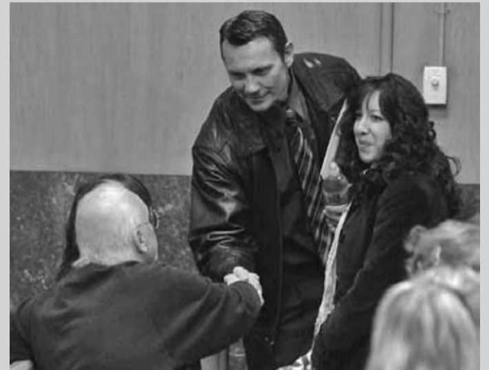
Семейство Нюмън не само, че не съжаляват за решението си, ами го определят като акт на вяра.

През март 2008 г. Маделин почина от форма на диабет,