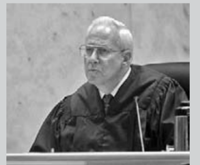
Според мнозина съдия Винсът Хауърд трябваше да бъде далеч по-строг в наказанието, поради липсата на осъзнаване на децата от страна на родителите.

Едно обаче е пределно ясно: за смъртта на малкото момиче трябва да бъдат винени родителите и определени християнски среди, но не и Бог. ХМ